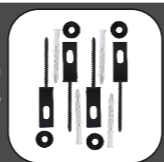
SPOJKA "O" RAL 9005