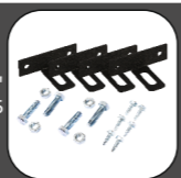
SPOJKA "T" RAL 9005