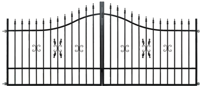
Brána 3,00 m x 1,20-1,50 m 3,50 m x 1,20-1,50 m 4,00 m x 1,20-1,50 m