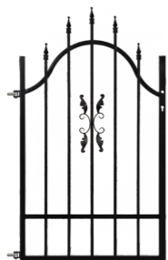
Bránka pravá / ľavá 0,90 m x 1,20-1,50 m