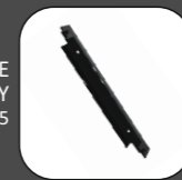
UZAMKNUTIE BRÁNKY RAL 9005