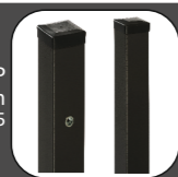
STĽP 100x100 mm RAL 9005