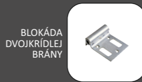
BLOKÁDA DVOJKRÍDLEJ BRÁNY