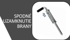
SPODNÉ UZAMKNUTIE BRÁNY