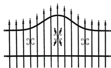
Ozdobný panel 2,00 m x 0,90-1,20 m