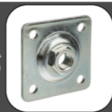
SPOJKA 80x80 mm