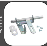
HORNÉ UZAMKNUTIE BRÁNY